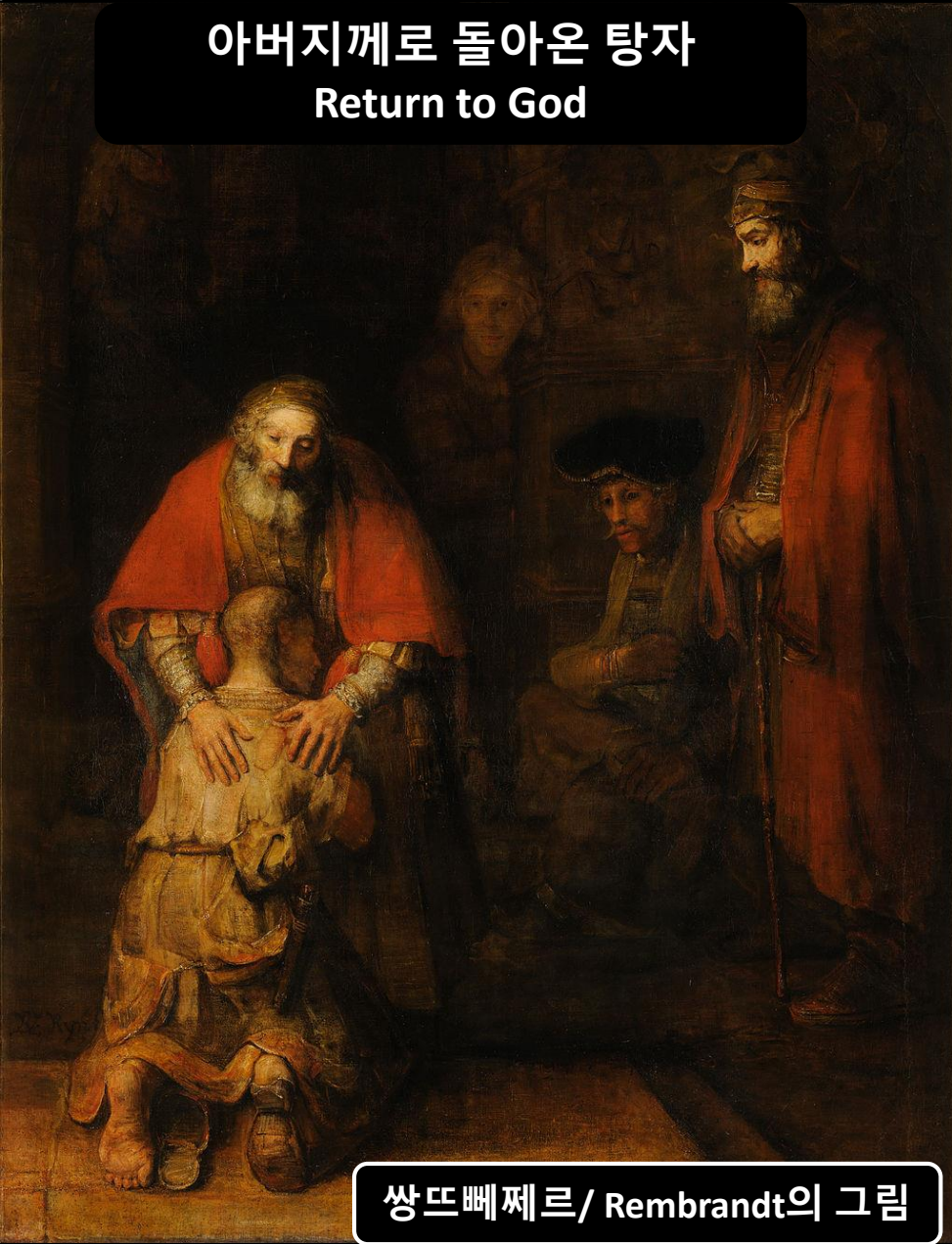
쌍뜨베제르 / Rembrandt의 그림

영접하는 자 곧 그 이름을 믿는 자들에게는 하나님의 자녀가 되는 권세를 주셨으니 이는 혈통으로나 육정으로나 사람의 뜻으로 나지 아니하고 오직 하나님께로부터 난 자들이니라(요1:12-13)