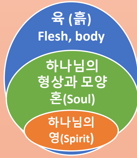
선악과 이전 창1:26, 2:7