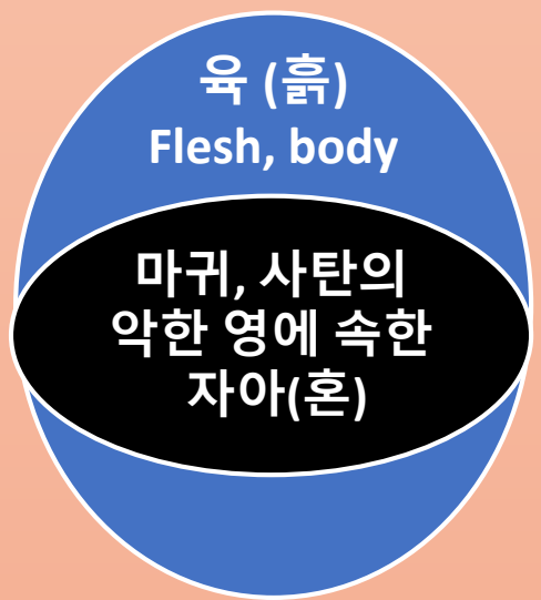
선악과 이후 창2:17, 3:6, 5:5

아담과 이브의 영과 혼은 선악과를 따 먹는 순간에 죽었고 악한 영에 속한 자아가 되었다 아담의 육신은 930세까지 살면서 마귀에게 속한 자녀를 낳고 죽었다 (창2:17, 3:6, 5:5, 요8:44)